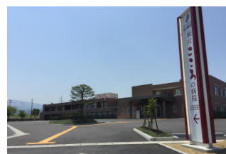
米沢こころの病院