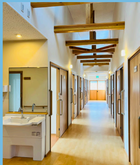
広く開放感のある通路