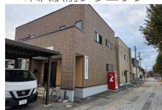
米沢就労支援センター