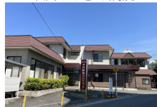
米沢駅前クリニック