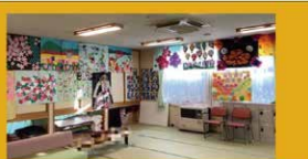
フロアから廊下まで 沢山の作品を展示