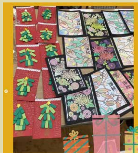
作品交換会をしました